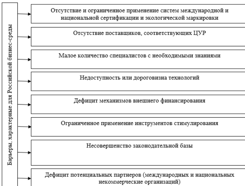
Рис. 2. Барьеры, характерные для российской бизнес-среды [7]